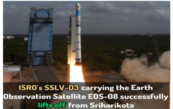
ISRO's SSLV-D3 carrying the Earth Observation Satellite EOS-08 successfully lifts off from Sriharikota