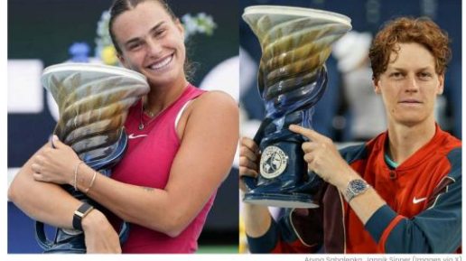
Aryna Sabalenka, Janik Sinner